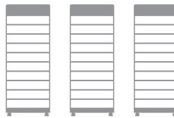
3 x HVB 29.6