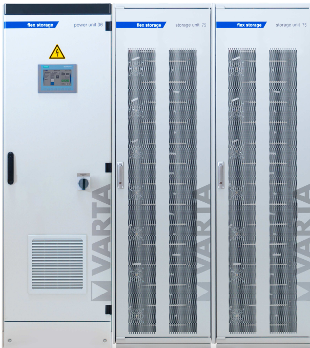
Abbildung 1: E 36/150 (50A ES) –beispielhafte Darstellung (Abbildung ähnlich)