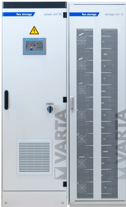
Abbildung 1: E 36/75 (50A ES) –beispielhafte Darstellung (Abbildung ähnlich)