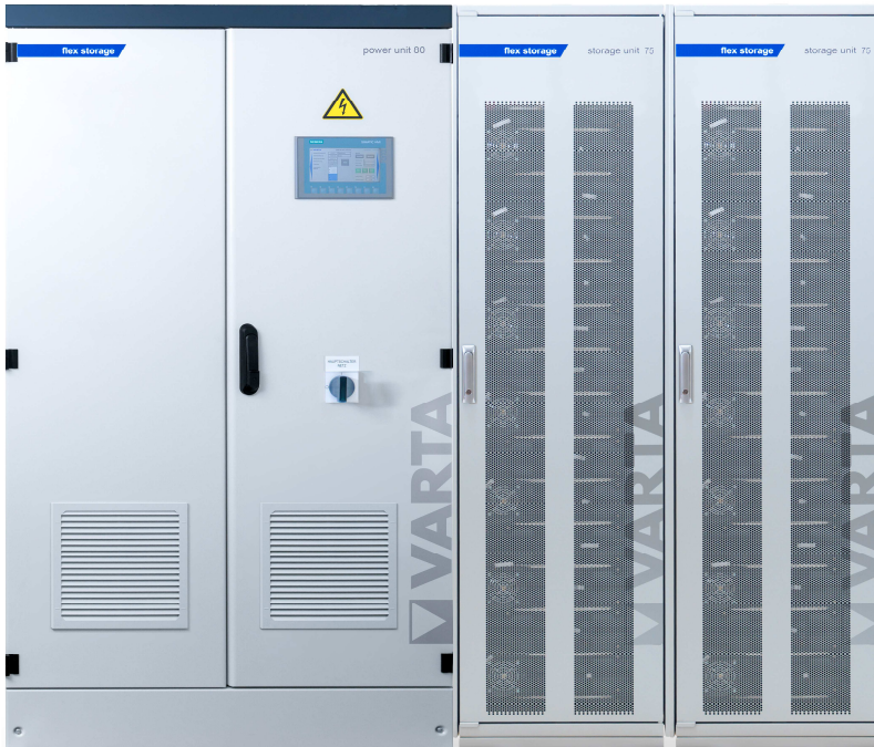
Abbildung 1: E 80/150 (115A ES) –beispielhafte Darstellung (Abbildung ähnlich)